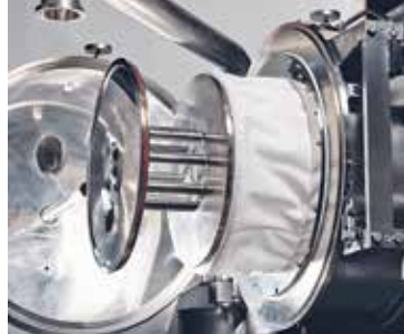
Entleerung mit umgedrehtem Filtertuch