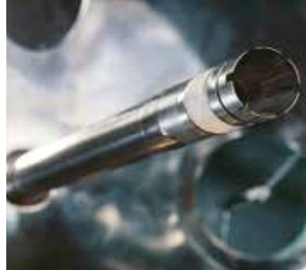
Drehbare Zuleitung mit PAC-Dichtung